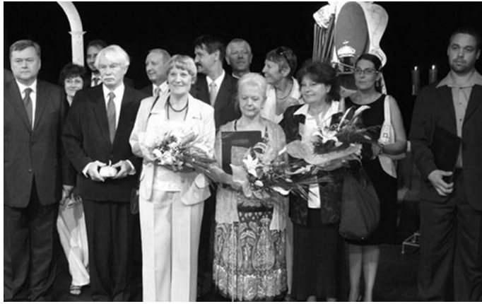
A díjat a Köztisztviselők Napja alkalmából Nyíregyházán, 2010. július 2-án tartott ünnepi ülés

Mátészalka Város Polgármesteri Hivatala életében először kapott köztisztviselő ilyen elismerést.