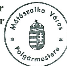
Hanusi Péter polgármester

A handwritten signature in blue ink, appearing to read 'Hanusi Péter'.