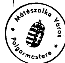
Hanusi Péter polgármester

A handwritten signature in black ink, appearing to read 'Hanusi Péter'.