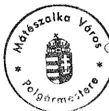
[Handwritten signature] Szabó István polgármester